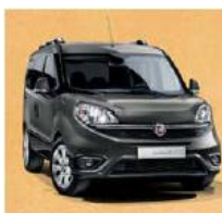
код фарби 695