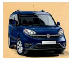
код фарби 487