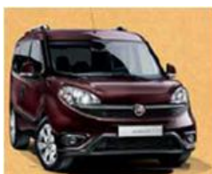
код фарби 590