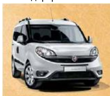
код фарби 249