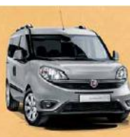
код фарби 612