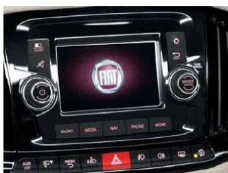
5" кольоровий сенсорний екран з радіо AM/FM, виходи USB, AUX