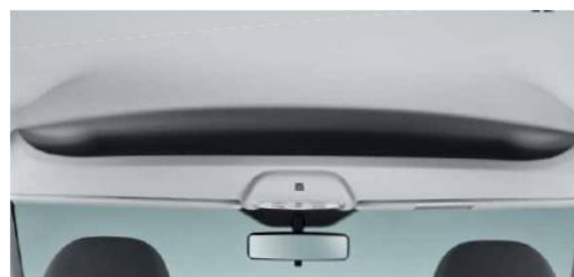
Місце для зберігання речей / документів під стелею