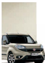
261 - PERLA