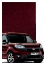
590 - BORDEAUX