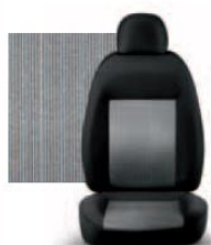
PIN STRIPE GRIGIO 223