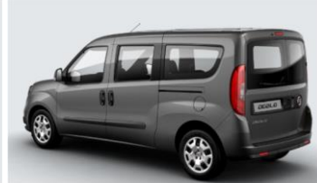
Забарвлення кузова фарбою металік (код 722)