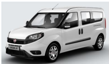
Забарвлення кузова пастельною фарбою білого кольору (код 249)