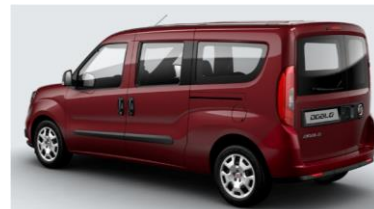
Забарвлення кузова фарбою металік (код 612)