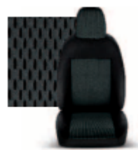
STAR GRIGIO 213