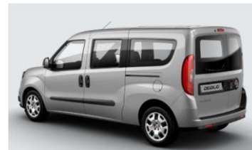
Забарвлення кузова фарбою металік (код 695)