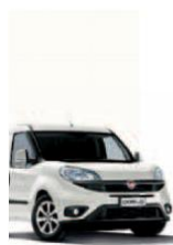
249 - BIANCO

Фарбування кузова пастельною фарбою білого кольору