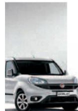
612 - GRIGIO CHIARO