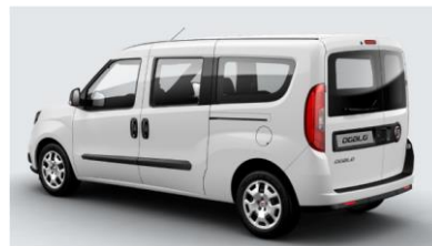
Забарвлення кузова фарбою металік (код 293)