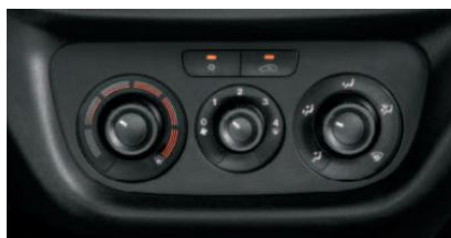
Кондиціонер з ручним регулюванням