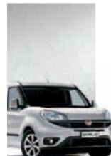
612 - GRIGIO CHIARO