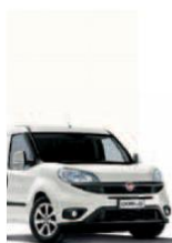
249 - BIANCO