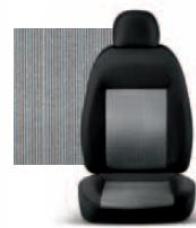
PIN STRIPE GRIGIO 223