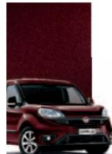
590 - BORDEAUX