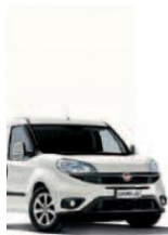
249 - BIANCO