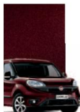
590 - BORDEAUX