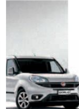
612 - GRIGIO CHIARO