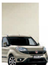
261 - PERLA