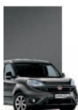
695 - GRIGIO