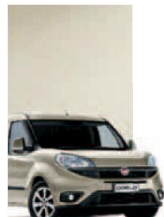
261 - PERLA