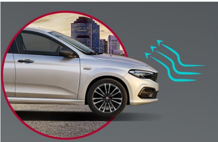
Активна заслонка решітки радіатора