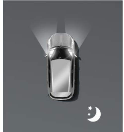
Автоматичне дальнє світло