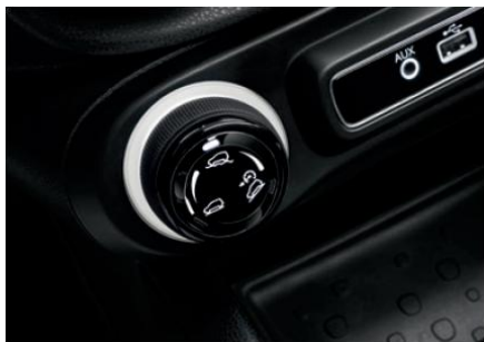
Drive Mood Selector (селектор вибору режиму водіння)