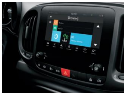
7" кольоровий сенсорний екран, радіо,